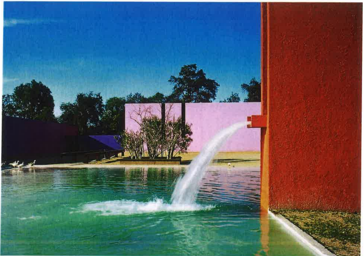
Exemplo 03 | Fonte dos Amantes no interior da Cuadra San Cristobal, México