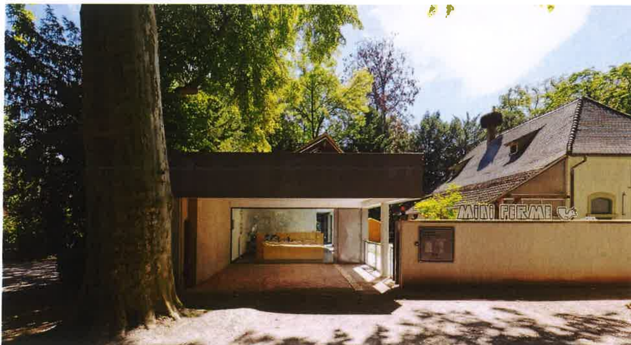
Exemplo 05 | Estruturas de apoio ao visitante da Mini Quinta Pedagógica do Zoo de Estrasburgo

Junto à extrema norte do complexo, serão ampliadas as construções existentes, nomeadamente o palheiro que terá a função de instalações individualizadas destinadas ao armazenamento de alimentos e ao seu manuseamento e ao armazenamento e lavagem de material e equipamento limpo associado à alimentação, sendo expandida a sua área a norte junto ao cais de abastecimento com acesso para a via pública, local estratégico para facilitar os percursos de logística da Quinta Pedagógica. Nesta área serão erguidas as estruturas para alojamento individualizado destinados à reprodução, a qual abrange maternidade, recria, quarentena, enfermaria e instalações de lavagem e higienização de animais bem como um gabinete veterinário com as comodidades e equipamentos exigidos para este tipo espaço. Pelo exterior, será servido de uma zona de apoio às actividades anteriormente descritas.