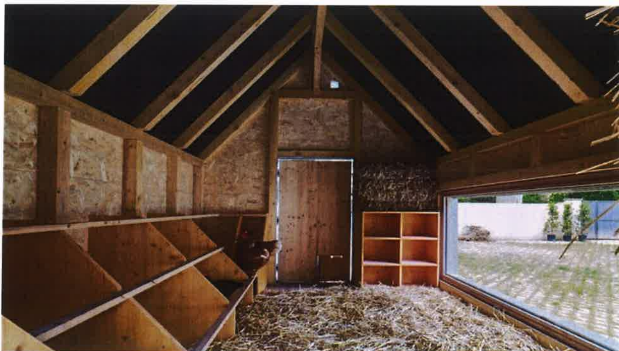
Exemplo 02 | Alojamentos Individualizados da Mini Quinta Pedagógica do Zoo de Estrasburgo

Quanto ao zonamento criado para albergar cada espécie ou grupo de espécies, desenhou-se um espaço limitado fisicamente pelos muros exteriores da quinta e pelos passadiços pensado para os diferentes tipos de habitat natural destas espécies, agregando elementos como lagos, a flora, matérias geológicas, entre outros, que simulem esses ambientes numa aproximação às características a eles inerentes, procurando encerrar os limites com elementos arbóreos para mitigar o ambiente de cativeiro. O pavimento destes zonamentos criados será desenvolvido numa manta predominante em terra vegetal, variando em detrimento das características de habitat natural de cada espécie, concebida sobre uma mancha de mantas geotêxtis e de canais de drenagem que viabilizem a compostagem da matéria orgânica, evitando o amontoamento dessa matéria que ocasionaria a degradação das condições de vida animal. Nas zonas com necessidade de um pavimento mais compacto, será desenvolvida num pavimento permeável.