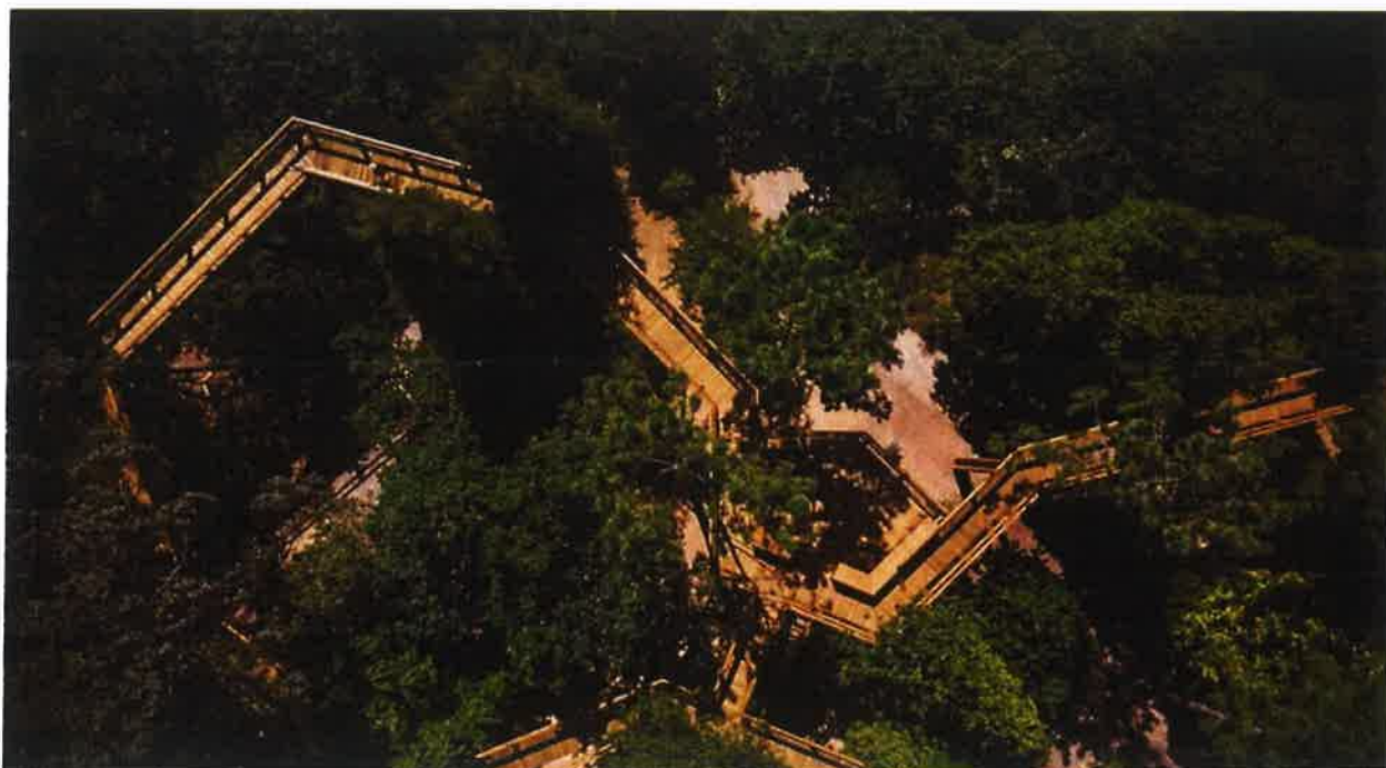
Exemplo 01 | Passadiços do Parque de Serralves

Apesar do carinho demonstrado ao longo dos anos pela população, as instalações da quinta carecerem de uma renovação da sua imagem que cative novamente o público a reatar a ligação familiar que aqui encontrou, sendo fundamental a procura de inovação por forma a dinamizar ainda mais a Quinta Pedagógica, proporcionando e garantindo melhor qualidade do espaço ao visitante bem como à equipa técnica. Contudo, o foco desta intervenção incide momentaneamente no bem-estar animal e, para tal, a proposta desenvolvida recai na renovação integral dos alojamentos dos animais, ampliando-as e simulando o habitat natural de cada espécie, provendo uma área equipada com materiais adequados à exibição do comportamento natural, bem como à satisfação das necessidades etológicas e fisiológicas, que permitam a execução de exercício físico e a fuga e refúgio de animais em esconderijos sempre que o desejarem, considerando ainda instalações para voo livre de aves, coberturas para bebedouros e comedouros.