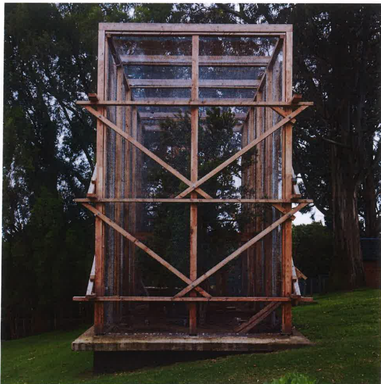
Exemplo 06 | Estrutura para voo livre de aves do Aviário e Estábulo de El Canto, Chile