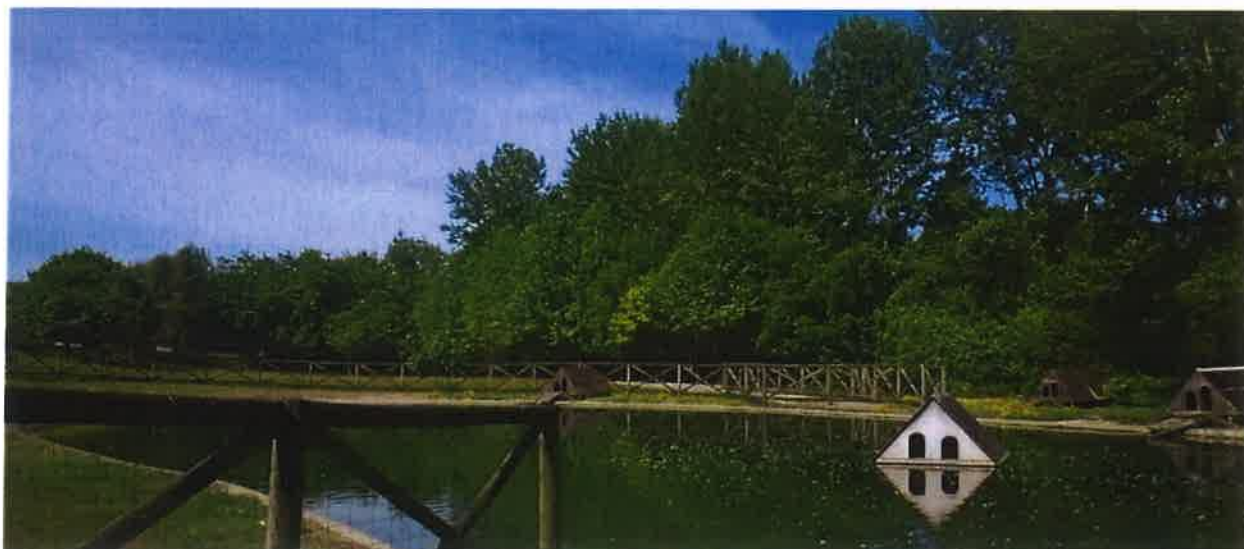
Exemplo 07 | Exemplo de zona de alojamento de patos, gansos e cágados (Quinta Pedagógica de Braga)