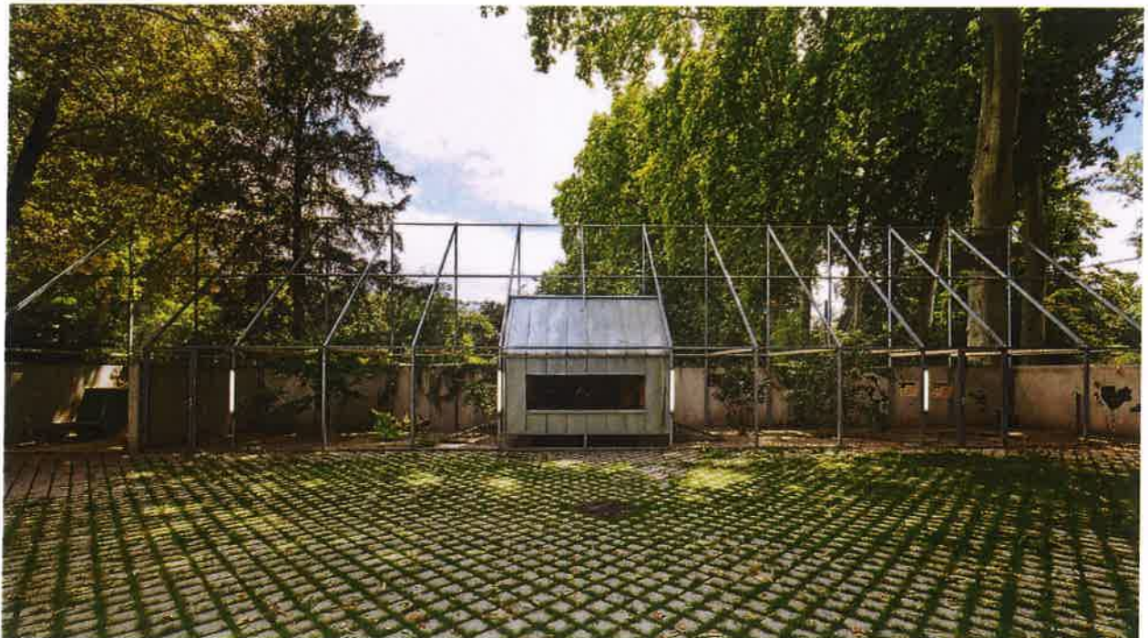
Exemplo 04 | Alojamentos para Galos do Mini Quinta Pedagógica do Zoo de Estrasburgo