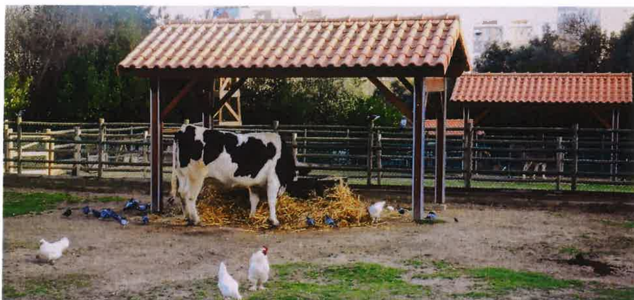
Exemplo 08 | Exemplo de estrutura para bebedouros e comedouros (Quinta Pedagógica dos Olivais, Lisboa)